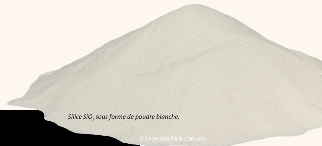
Silice \text{SiO}_2 sous forme de poudre blanche.

– Dans le cadre de suppuration chronique des tissus, la Silice aura un rôle de protection