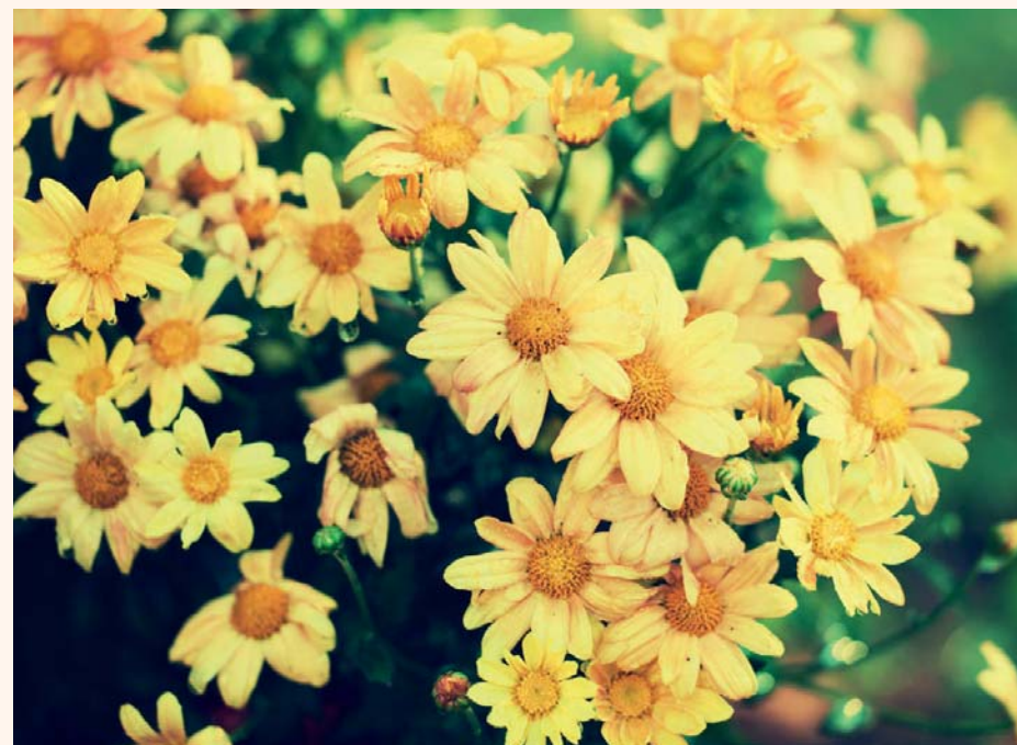
Chrysanthellum americanum , plante drainante du foie, avec un rôle hépato-protecteur.

Dans ce cadre indicatif, Ce remède favorise une action drainante du foie et anti-inflammatoire.