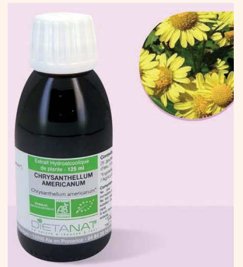
Pratique : Préparation de teinture mère prête à l'emploi en la diluant dans un peu d'eau.

Action ciblée en prémédication d'une intervention chirurgicale pour un patient présentant une fragilité hépatique et vasculaire,